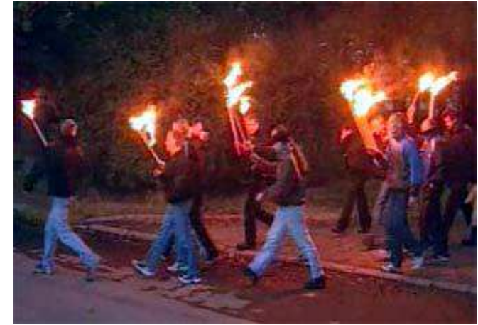
Скинхеды. Факельное шествие в Петербурге.