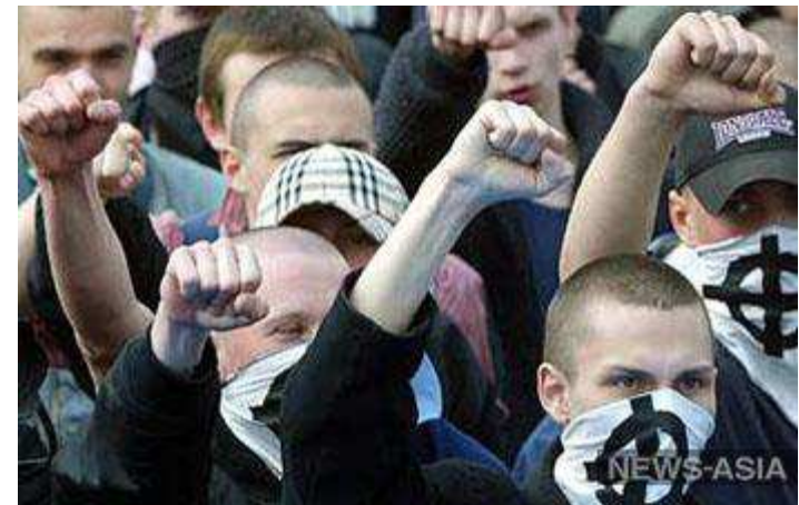
В Костроме скинхеды напали на неформалов